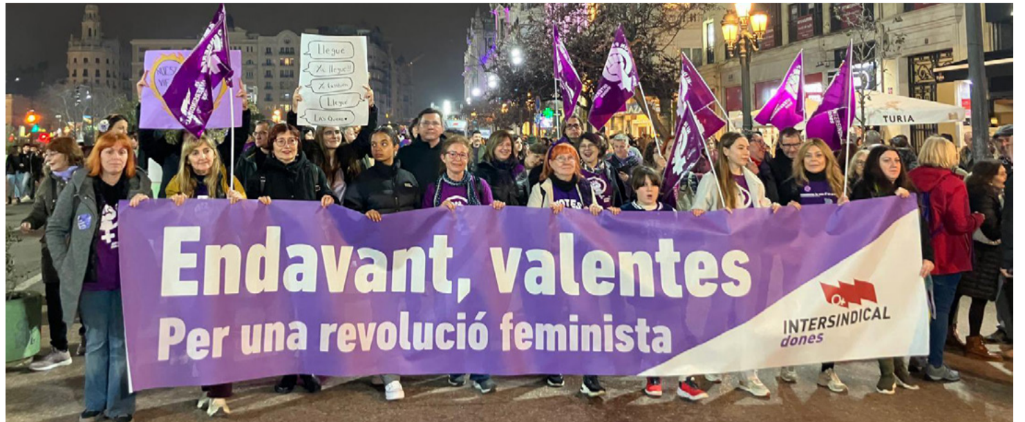
Dones d'Intersindical en la manifestació a València del 8 de març de l'any passat

Les xiquetes que en un futur vulguen dedicar-se a la música compten amb referents potents en qui emmirallar-se