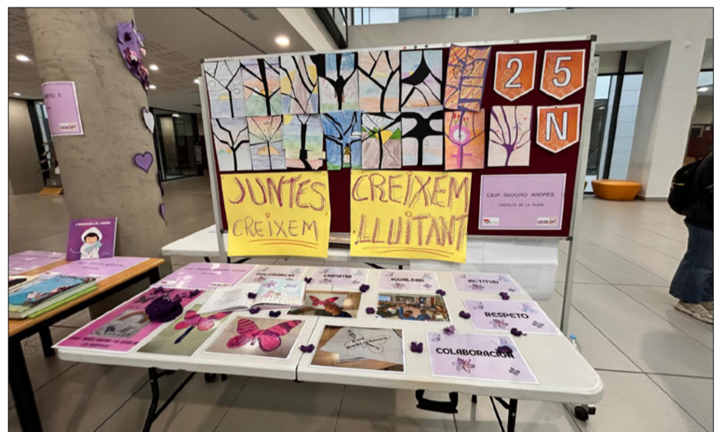
Un dels treballs coeducatius del Coeducart de Castelló d’enguany

El projecte ha fet un pas especialment rellevant: actualment CoeducArt ja està inclòs en el currículum dels graus d’Educació de la Universitat d’Alacant