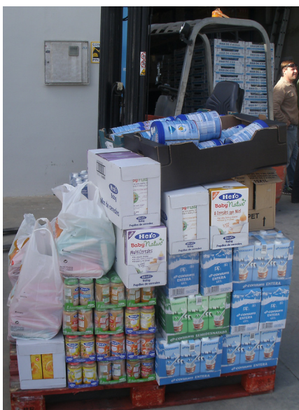
STM va donar vora una tona de productes de primera necessitat al Banc d'Aliments de València

Por ello nuestro Secretariado Nacional, además de condenar esta represión sindical y social, se suma a la campaña del SAT para recaudar fondos con los que afrontar el pago de sus multas y además de nuestra aportación económica, os animamos a que vosotras y vosotros también aportéis lo que podáis. En su página web http://www.sindicatoandaluz.org/ , podéis encontrar toda la información, incluido el número de cuenta.