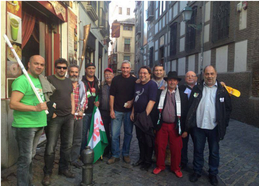
Membres de STM i d'Intersindical, en un acte de solidaritat amb el SAT a Granada.