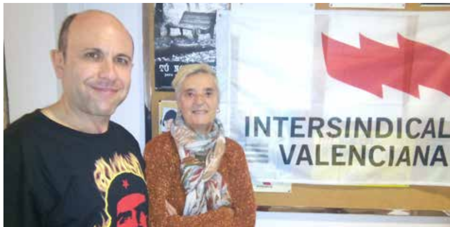
Donació a l'Associació d'Amistat amb Cuba "José Martí"

En el mes de gener farem una altra donació, de productes de primera necessitat, a alguna organització d'ajuda