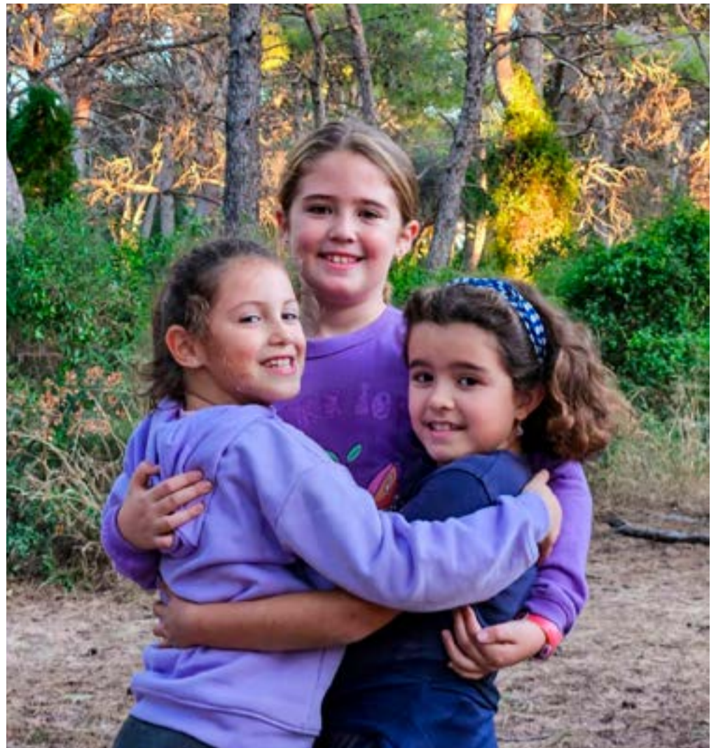
Alumnes de l'escola d'El Saler, en la pinada d'enfront del centre

Ubicada en un espai natural d'una bellesa inqüestionable, en plena Devesa, l'escola sempre ha tingut al centre del seu projecte educatiu el seu entorn tan especial i l'aposta pel valencià, cosa que l'ha fet tornar doblement atractiva, fins al punt que hi ha hagut anys on ha estat tan sol·licitada que fins i tot veïns del poble no han pogut