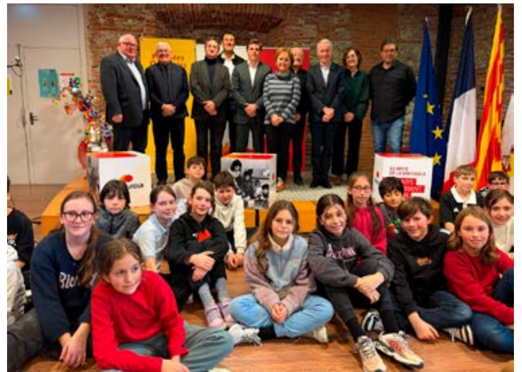
Presentació al febrer a Perpinyà de la commemoració del 50 aniversari de La Bressola

difusió de la tasca de La Bressola, un impuls per continuar desenvolupant la llengua i la cultura catalanes a la Catalunya del Nord i un impuls en el projecte de la casa. Un projecte viu, fidel als seus valors i obert als temps que venen.