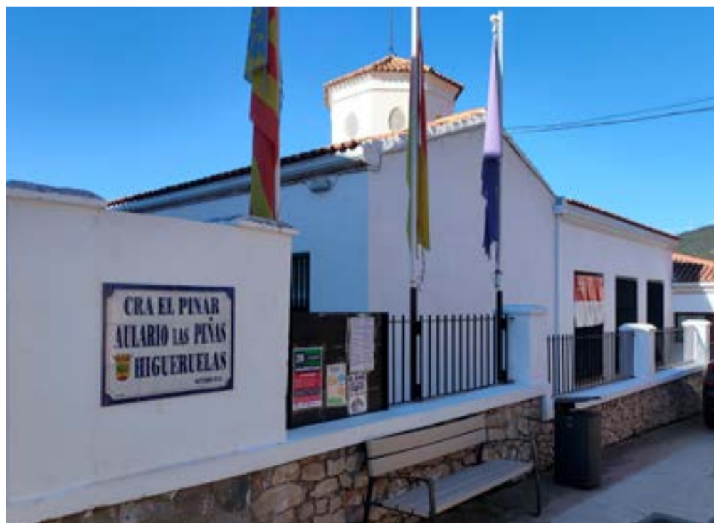
Aulari d'Higuieruelas del CRA El Pinar

Aquest va ser el procés llarg i tediós que va haver d'afrontar la directiva d'aquest centre perquè la Conselleria acceptara la voluntat de les famílies. Un camí ple de pedres i obstacles per a poder incorporar el valencià amb normalitat en una zona de predomini lingüístic. Les famílies, a diferència del govern valencià, van tindre clar que el valencià és una llengua d'oportunitats, d'integració i de futur. Perquè som la clau del futur. Perquè amb el valencià obrim totes les portes.