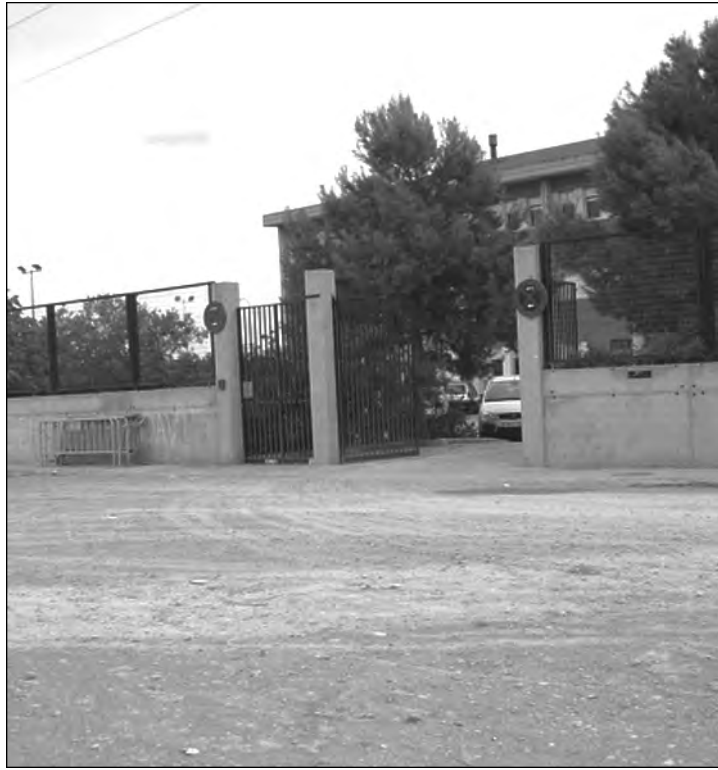
Aspecte de l'entrada del IES Pla del Quint en Mislata.

La Generalitat va crear el 2001 l'empresa Construccions i Infraestructures educatives S.A. (CIEGSA) amb l'objectiu de finalitzar el mapa escolar dels centres escolars publicats pel Partit Popular el 1996. STEPV-IV va criticar des del primer moment CIEGSA, un instrument concebut per a servir a la privatització encoberta de la gestió de la construcció de centres de la pròpia Conselleria de Cultura i Educació. Aquesta empresa ha aplicat una gestió totalment opaca, des de les contractacions del personal directiu i els arquitectes fins les adjudicacions de les obres i els seus pressupostos milionaris. El seguiment que les Corts Valencianes han intentat realitzar a la gestió de CIEGSA en tots aquests anys ha esdevingut una missió impossible per la falta d'informació completa i transparent i per l'oposició del PP a crear una comissió d'investigació.