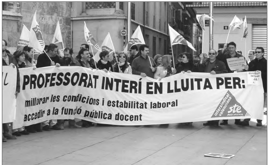
Concentració sindical de suport al professorat interí davant la Generalitat

Secretariat Comarcal STEPV Baix Vinalopó.