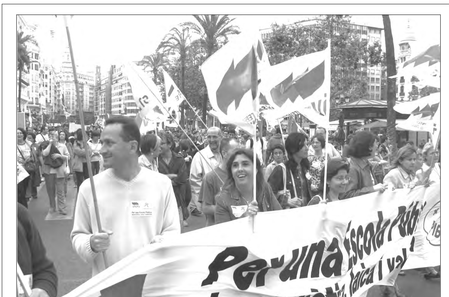
Un aspecte de la manifestació celebrada a València l'11 de maig en defensa de l'Escola Pública/ JORDI BOLUDA