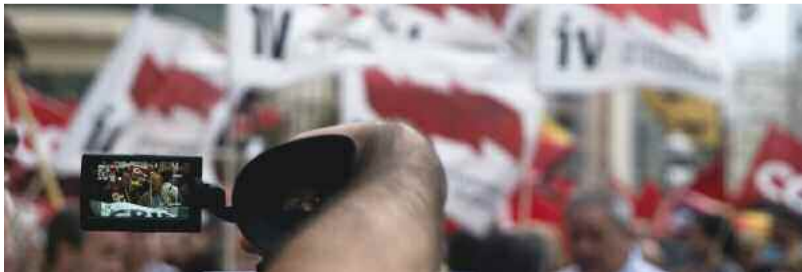
5000 persones es manifesten contra les directives europees i per demanar que la crisi econòmica no la paguen les treballadores i treballador / A.S.

Intersindical Valenciana no va signar aquest acord de la Mesa General de la Funció Pública.