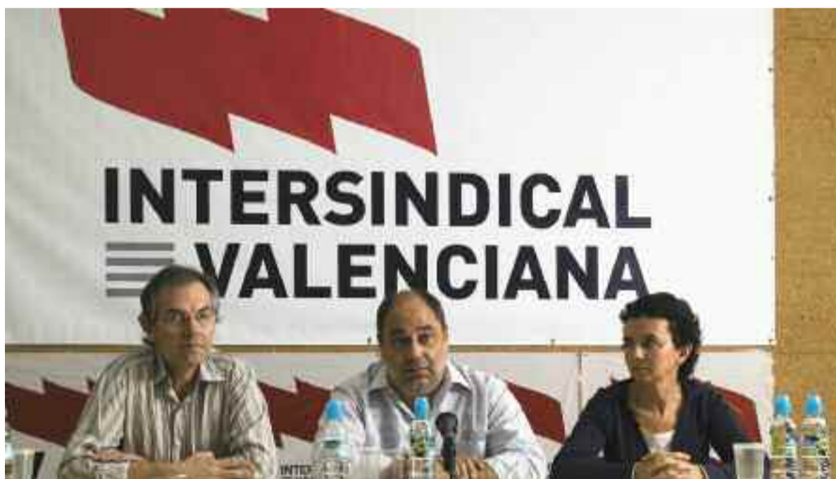
Els representants sindicals, durant la roda de premsa de presentació de manifest a València, el 8 d'octubre

Finalment, USTEC-STES, STEI i STEPV plantegen la necessitat de "desenvolupar les planificacions lingüístiques que s'han revelat arreu del món, en societats plurilingües, com les més adients, i que passen, necessàriament, per la utilització vehicular de la llengua més desafavorida socialment".