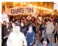
Carrer de la Pau