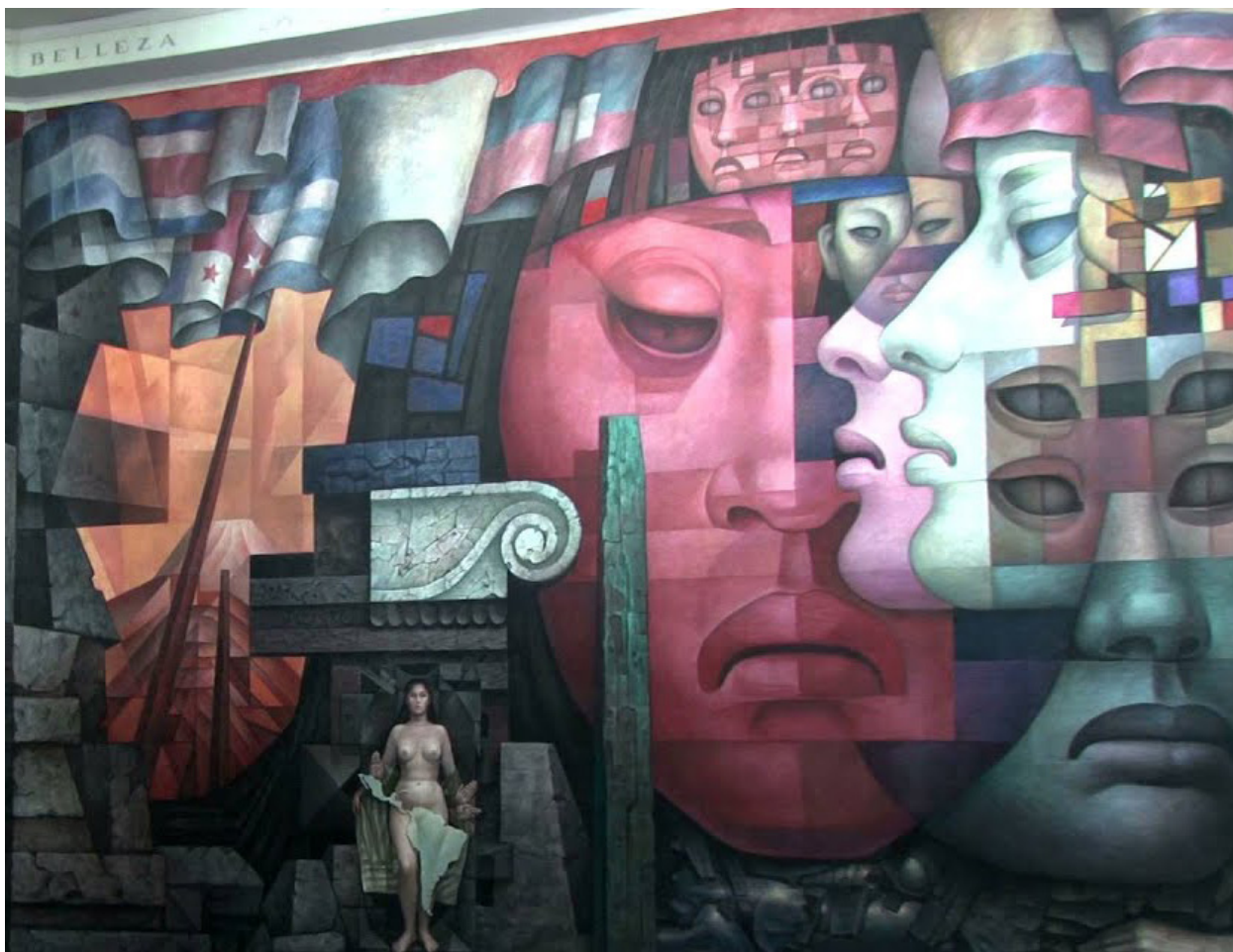
Integració d'Amèrica Latina, mural pintat per l'artista mexicana Jorge González Camarena entre novembre de 1964 i abril de 1965.

mes internacionals, com l'FMI, l'OCDE i l'OMC, torpedinen les polítiques socials i les ataquen en considerar-les com a populistes, amb el bloqueig de crèdits i la negació de préstecs. En aquesta dinàmica, la dreta recupera espais de poder formal, a través de cops d'estat, frauds electorals o amb la capitalització del descontent social. Avui es parla de necropolítica, o guerra contra els pobres. Es tracta d'abandonar-los, de deixar-los morir; no són importants en aquesta fase del neoliberalisme. Les grans migracions que avui sacsegen la regió, sobretot a Centreamèrica, amb famílies senceres lliurades a la seva dissort sense feina, sense una opció de futur, abandonen els seus països per no morir d'un tret o d'inanició.