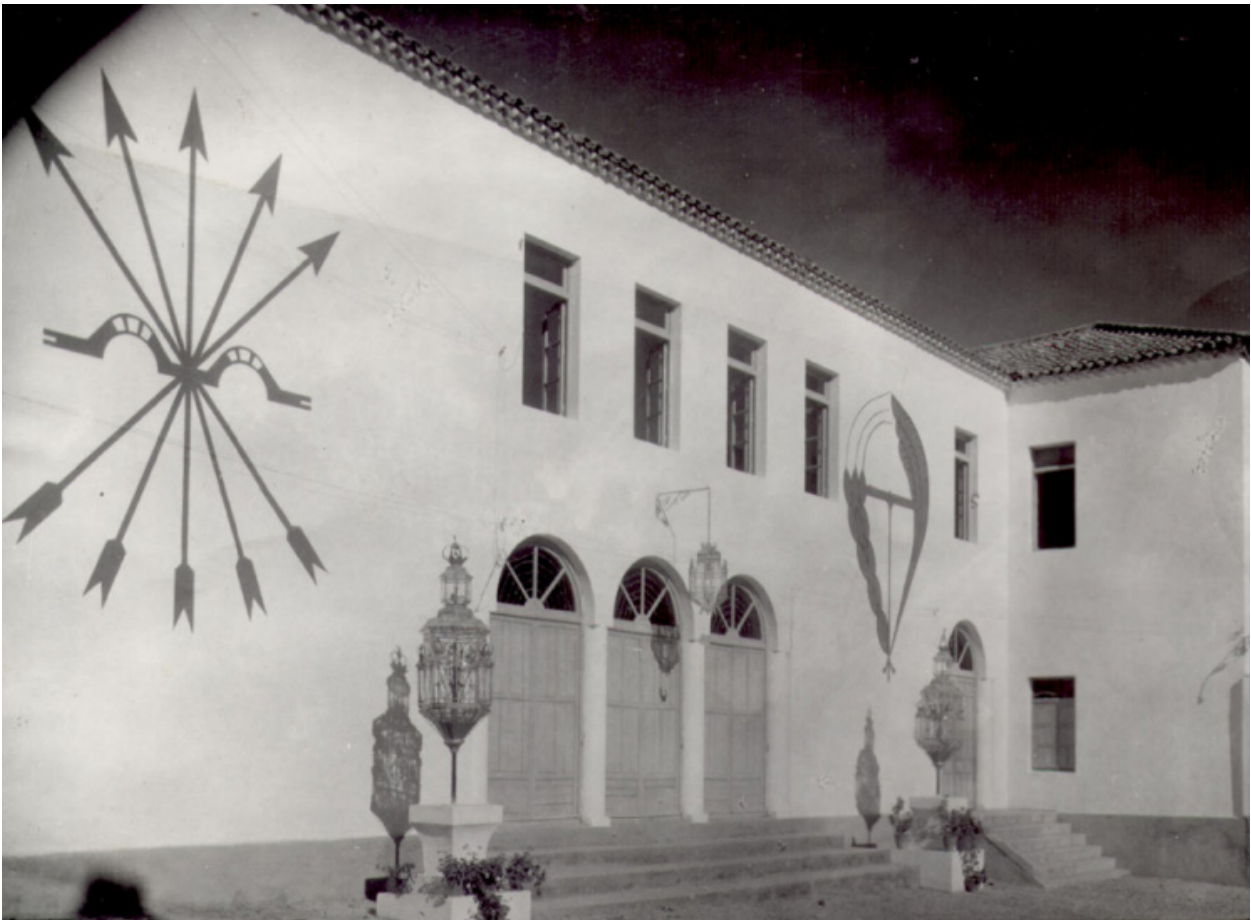
Grup Escolar Álvarez Cubero.