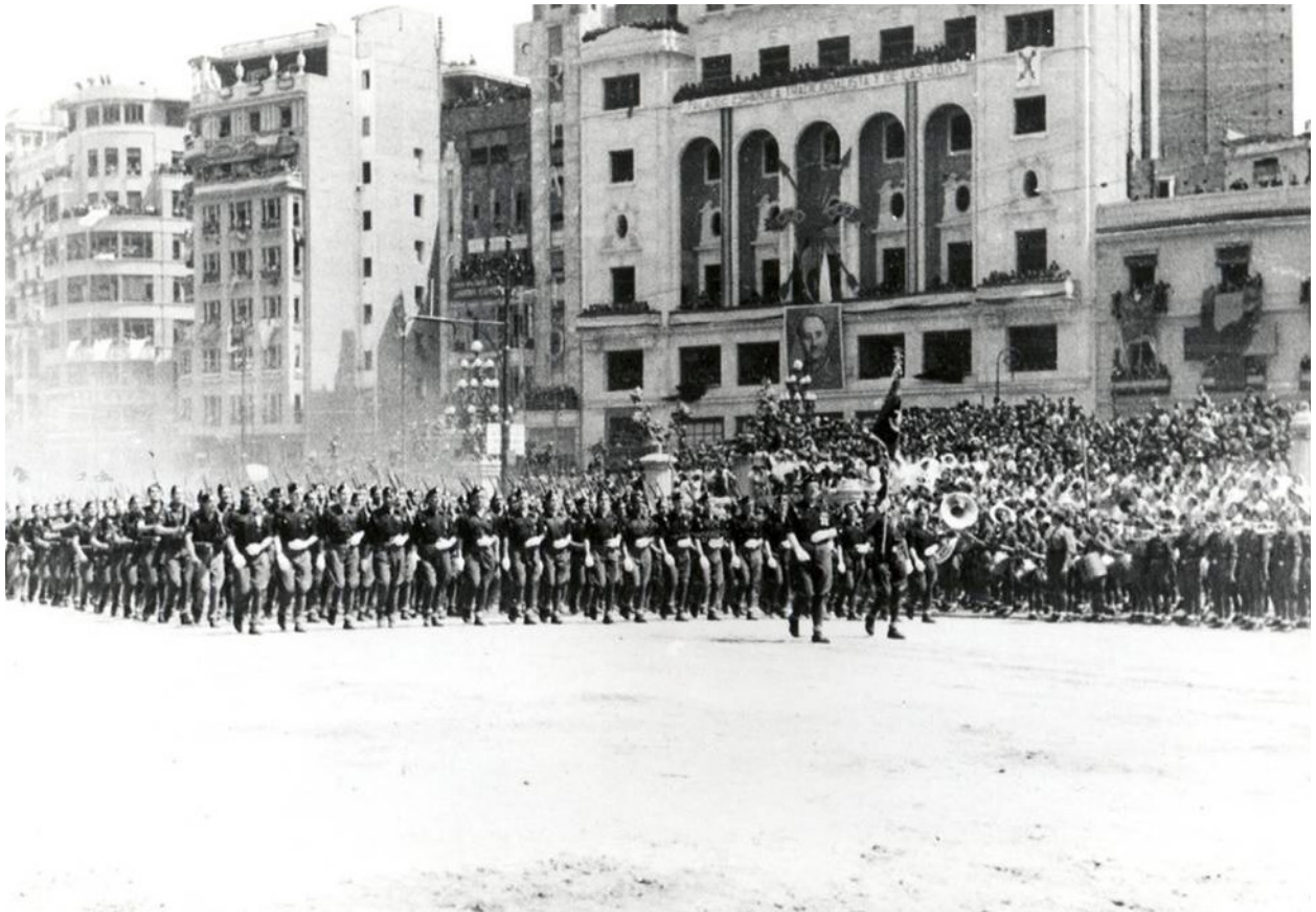
1939-Entrada tropes franquistes.

amb tots els seus mitjans l'obra modèlica de Godàs, que va haver de fer front a les nombroses crítiques i als atacs dels sectors més intolerants de la societat, que s'oposaven a la modernitat pedagògica i, sobretot, s'enfrontaven al model de laïcisme escolar. Godàs se'n va sortir i la seva escola no solament fou una fita per als lleidatans de la capital, sinó també per a moltes famílies de les comarques de ponent que feren del Liceu Escolar la seva escola.