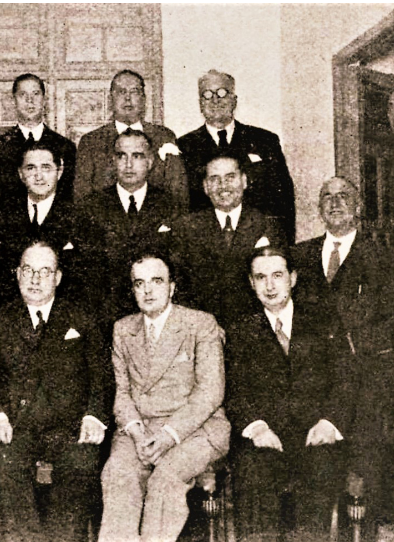
els seus companys de claustre des instituts Aguilar y Eslava i Niceto Alcalá-Zamora.

nisteri d'Instrucció Pública, publicava a la premsa madrilenya un breu article titulat "L'Escola i el Poble. Allò que farà la República", en el qual afirmava que: