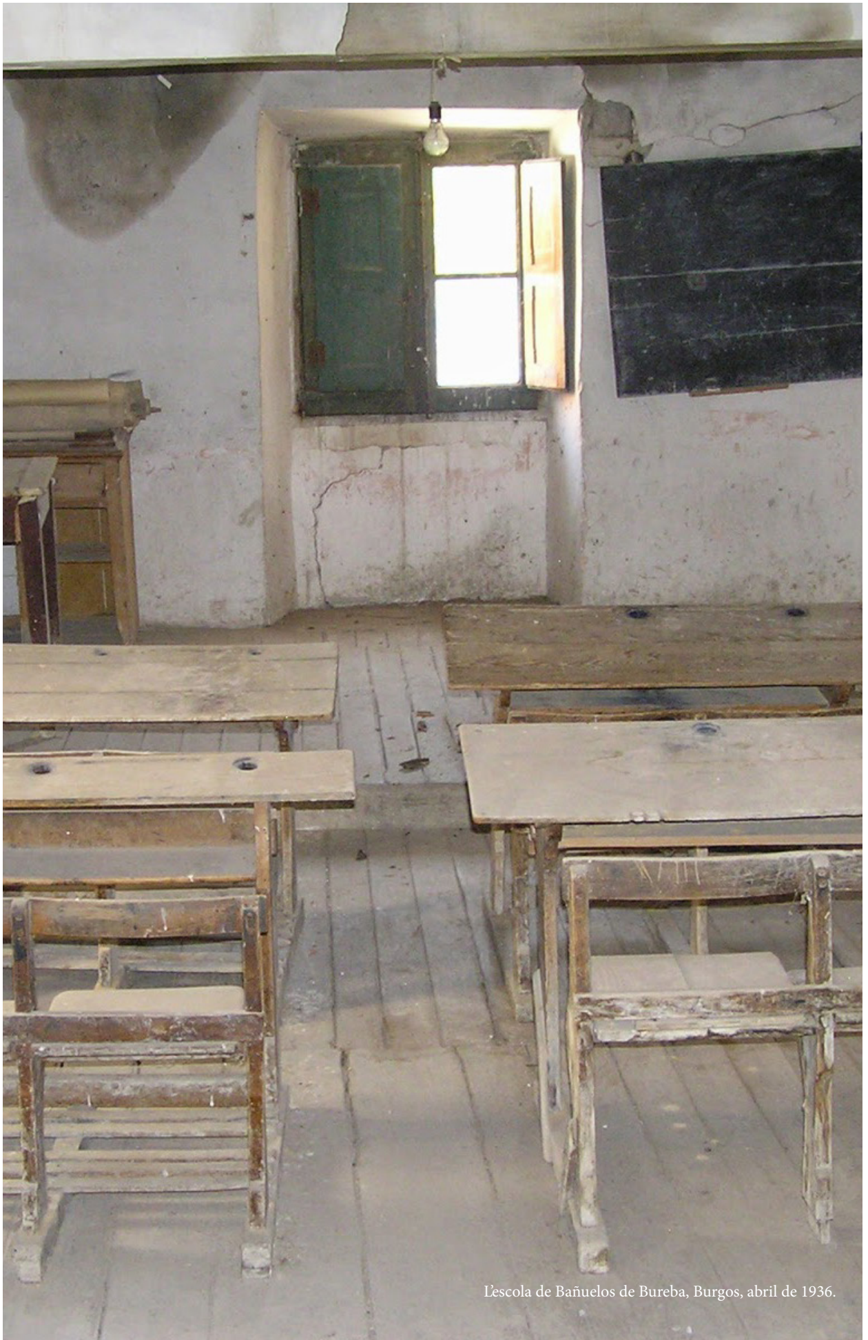
L'escuela de Bañuelos de Bureba, Burgos, abril de 1936.