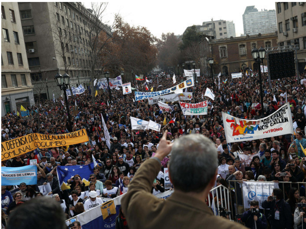
Vaga nacional de mestres, a Santiago de Xile, 20 de juny de 2019.

cionats. Actualment aquest sector posseeix prop del 70% de la matrícula escolar; malgrat això, és consens majoritari que Xile té greus problemes de qualitat educativa. El mateix Simce, indicador de mercat del model, demostra que malgrat la postergació de l'educació de propietat de l'Estat, aquesta obté millors aprenentatges de les i els estudiants (Mayol, Araya, Azócar, 2011). Com en la immensa majoria del món, la millor possibilitat d'assegurament del dret a l'educació i increment d'una educació per a la vida i de qualitat educativa integral està en l'enfortiment de l'educació pública com a referent sistèmic de qualitat. I en el cas xilè és la recuperació planificada, finançada i sistemàtica de l'educació pública, vinculada a un pla de desenvolupament nacional.