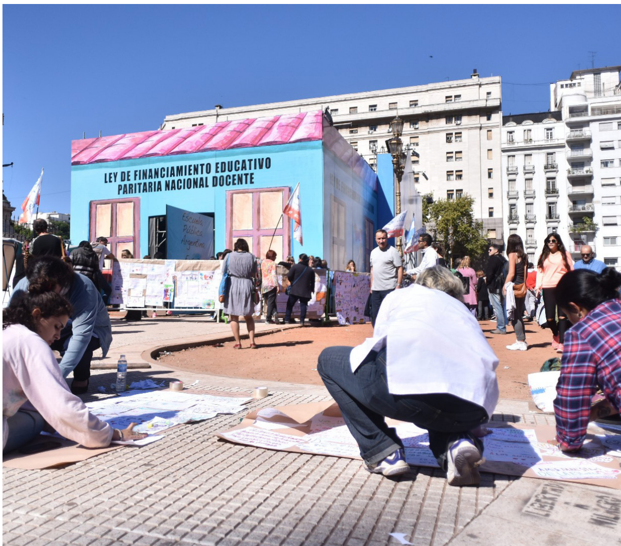
Escola itinerant instal·lada a la plaça de "los Dos Congresos".

docència i a les diverses formes de resistència organitzada que despleguen els sindicats davant l'avanç conservador i neoliberal a l'Argentina.