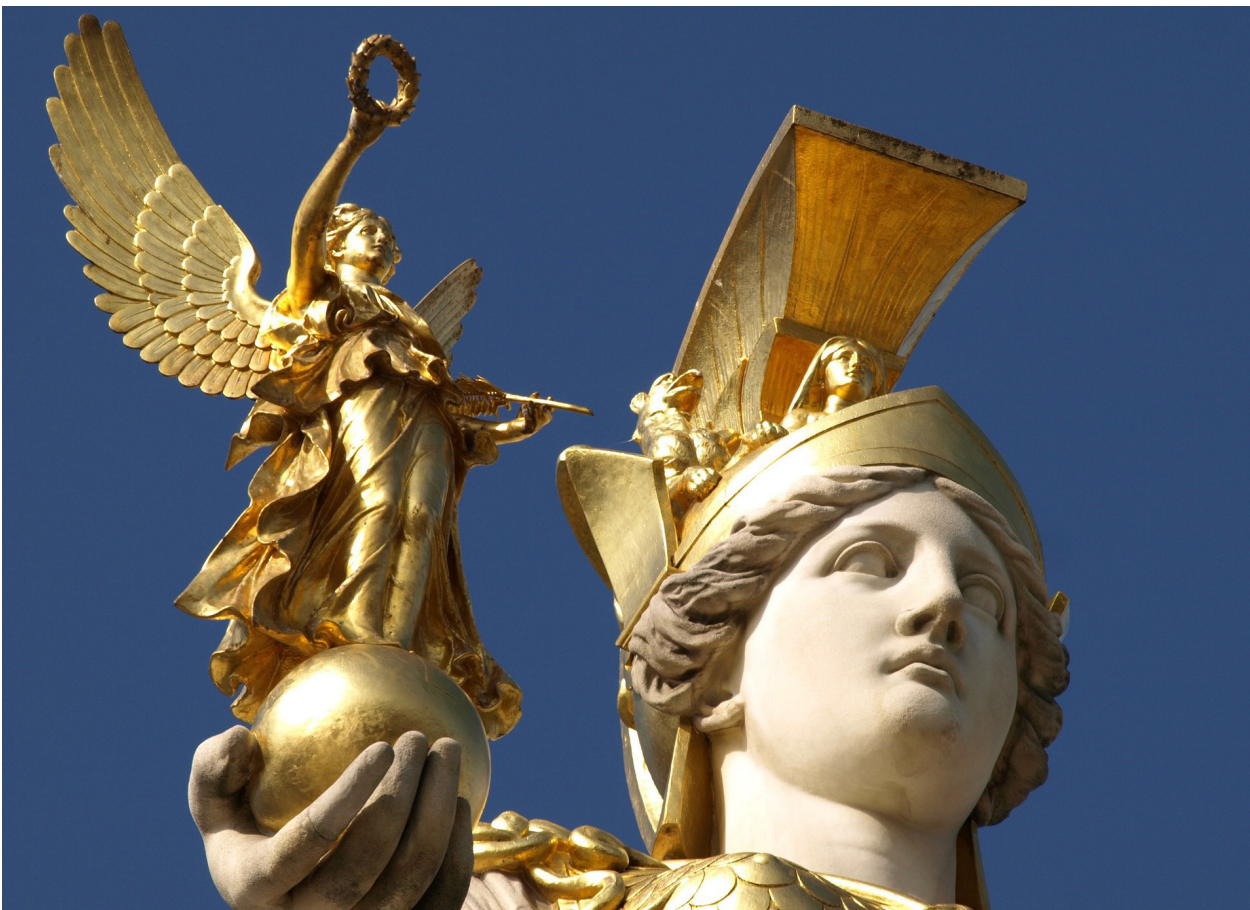
Athena filla de Zeus, deessa de la saviesa, de les arts i de l'artesania, escultura grega.

Atès que el nou professorat no te adjudicat un lloc permanent, això suposa perjudicis tant per qui és permanent en actiu, com per qui s'incorpora, amb llocs temporals i substitucions.