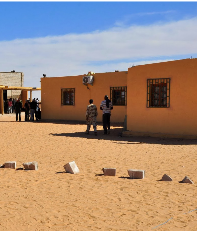
Escola saharauí d'Art.

Només amb l'enfortiment del paper dels docents, la família i les institucions de la comunitat civil, associacions de pares i mares, treballadors socials en col·laboració amb les institucions públiques i l'ajuda internacional es podrà avançar per a la contribució en el desenvolupament i la promoció dels programes educatius.