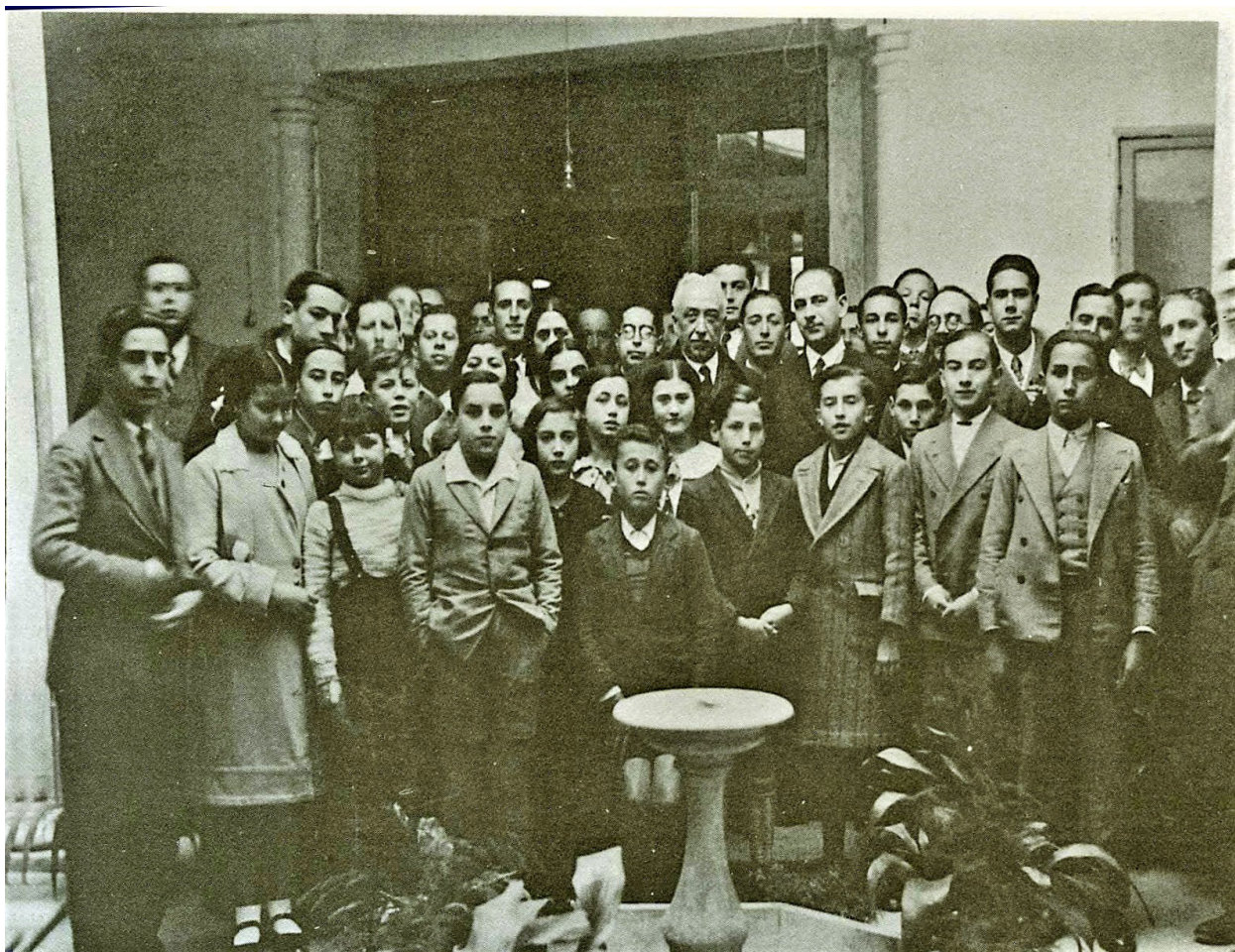
Alumnat de l'Institut de Segona Ensenyança acompanyat del President de la República.

contra la Llei de Confessions i Congregacions Religioses 11 . Simultàniament a la publicació d'aquestes pastorals, als mitjans de comunicació més conservadors es desfermava una duríssima campanya contra la República.