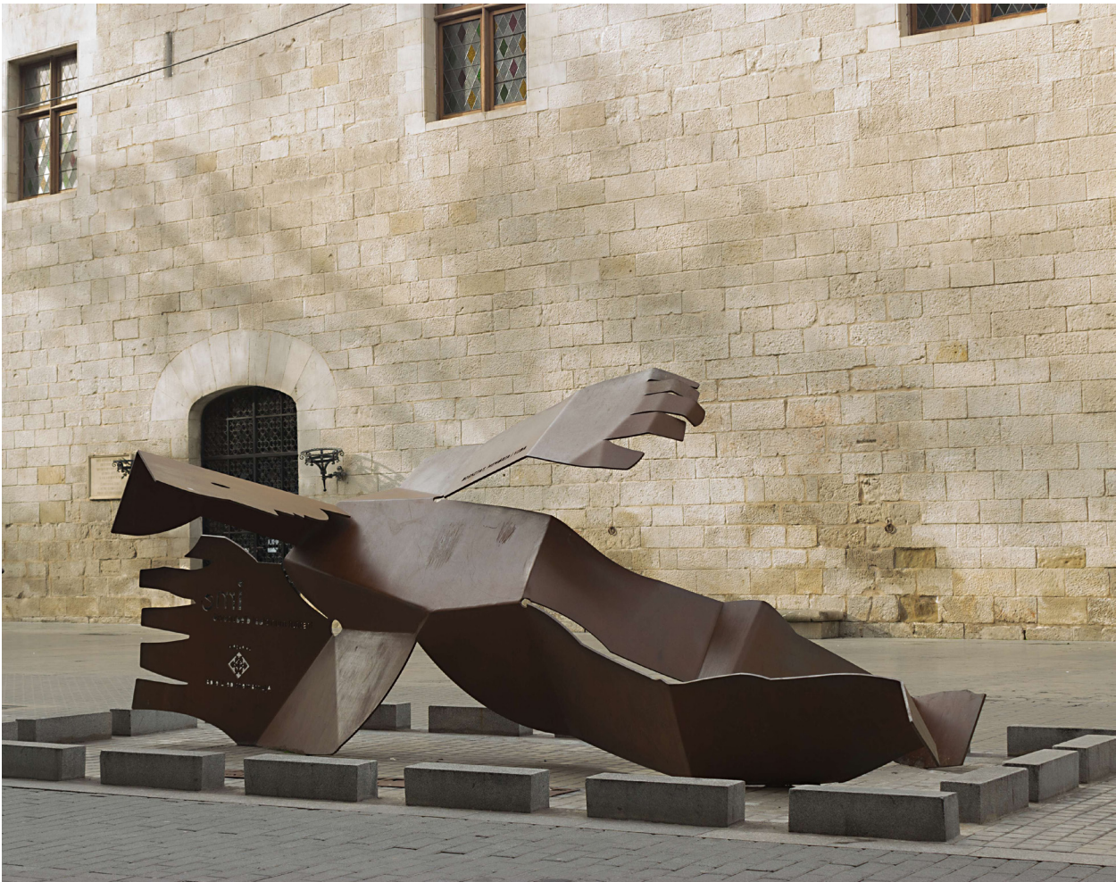
“Memòria, Dignitat i Vida” de l'escultor lleidetà Agustí Ortega a prop del lloc que ocupava l'escola.

L'entrada a l'escola era a les vuit del matí, a les nou esmorzaven, a continuació es feia una classe a l'aire lliure, d'onze a dotze gimnàstica i natació (quan feia bon temps). Després de dinar descans a la platja i a la tarda jocs i estudi a les aules, berenar i a les cinc sortida de l'escola. Els alumnes disposaven d'una barca, Nausica , amb un vigilant que feia tasques de socorrista. Aquest centre escolar municipal va publicar la revista Garbí , que recollia fins i tot estudis de meteorologia subministrats per l'Observatori Fabra, i va editar llibres adreçats als seus alumnes, com ara, L'Escola del Mar , El Llibre del Mar , a Les representacions de titelles a l'Escola del Mar , La vida social a l'Escola del Mar , etc. L'Escola del Mar fou molt valorada pels pedagogs tant del país com de l'estranger que la visitaven sovint i entre els visitants més il·lustres figuren el matemàtic Albert Einstein, que hi anà durant la seva estada a Barcelona al febrer de 1923, i el president Francesc Macià a l'estiu de 1931.