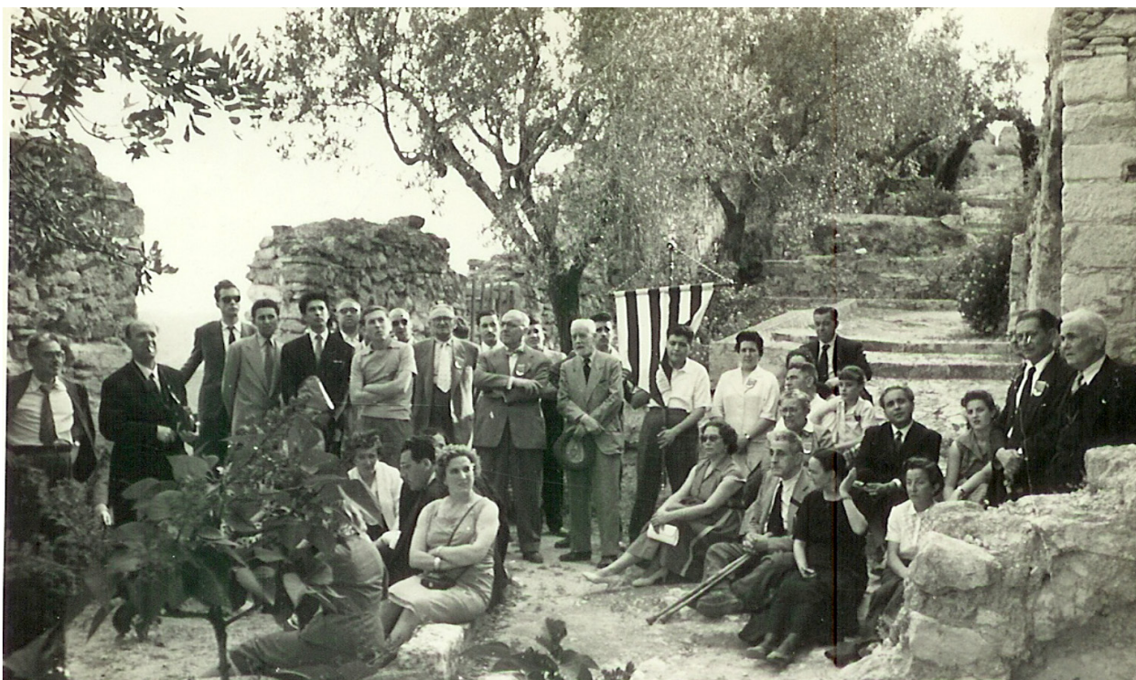
1957-Aplec de Lo Rat Penat a Xàtiva.

altra llengua s'obligarà a traduir al castellà fins els noms personals que ja existien abans de la Guerra Civil.