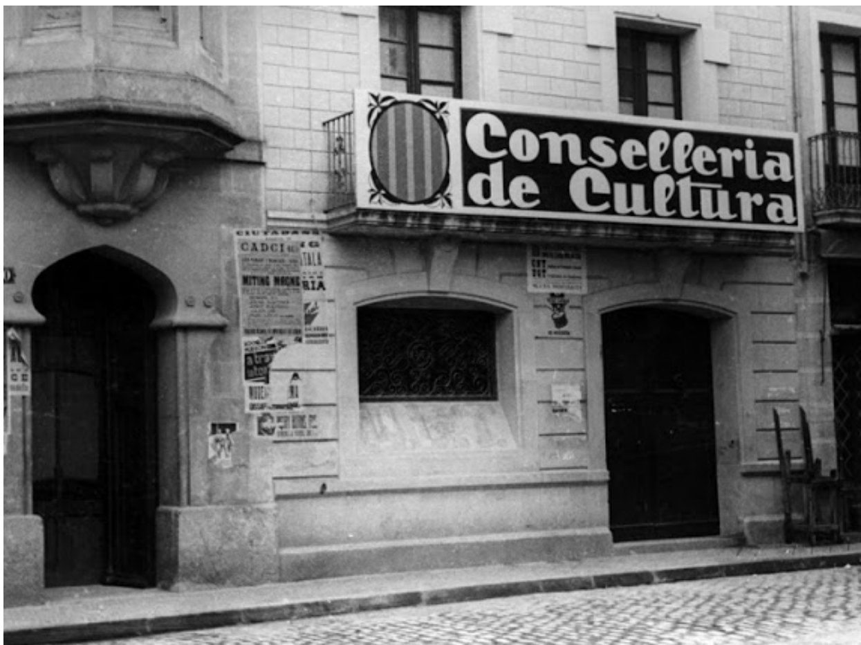
Seu del Consell de l'escola nova unificada (CENU) Barcelona.

de turc i, en un judici sense proves i carregat d'irregularitats l'acusen de ser-ne l'instigador i és condemnat a mort i afusellat. El fet, commociona tot Europa, i el converteix en un dels principals màrtirs de la pedagogia.