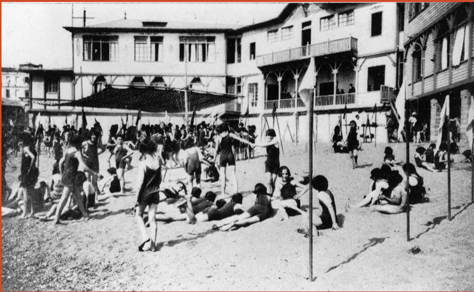
Vista de la platja amb alumnes de l'Escola del Mar

“A les nostres mans tenim triar la platja que volem”