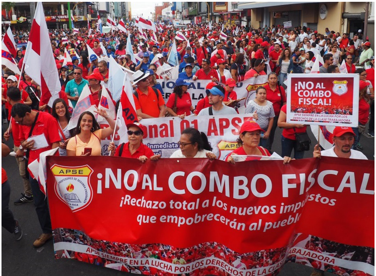
Vaga nacional enfront el Combo Fiscal projecte 20.580, 25 d'abril de 2018, San José, Costa Rica.

sures administratives atemptant a la nostra integritat familiar, laboral, emocional i psicològica.”