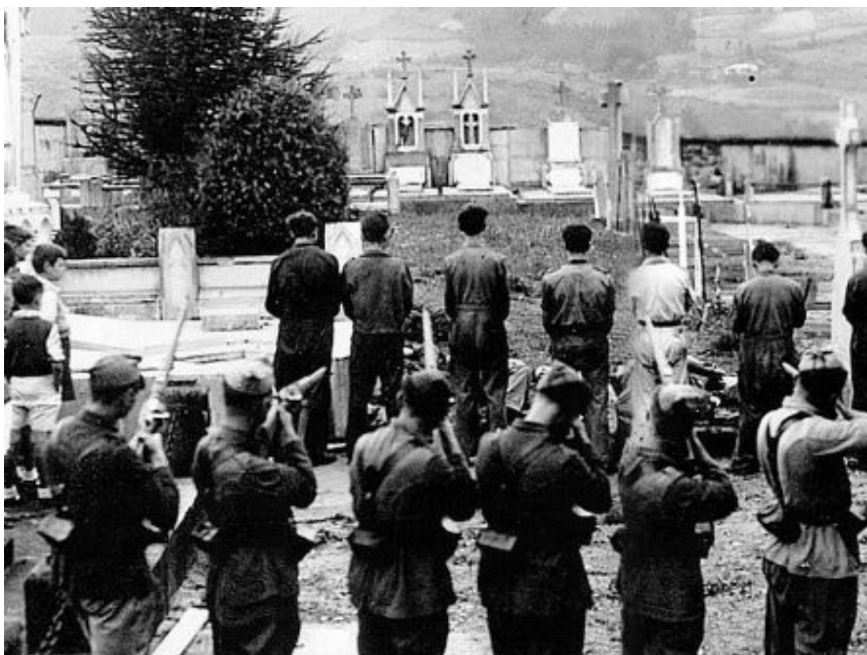
Afusellament de persones contraries al règim franquista.

Com en pràcticament totes les localitats de la Subbètica cordovesa, el cop d'estat triomfa ràpidament a Cabra i el 19 de juliol a la tarda el capità de la Guàrdia Civil, Francisco López Pastor, emet un ban de guerra i destitueix l'ajuntament republicà. La sublevació va comptar a la zona des del principi amb el suport de falangistes, requetés i alguns militars com el comandant de cavalleria retirat Ramon Escofet Espinosa i el tinent de complement Luis Pallarés Moreno (Moreno, 2008, pp.268-273).