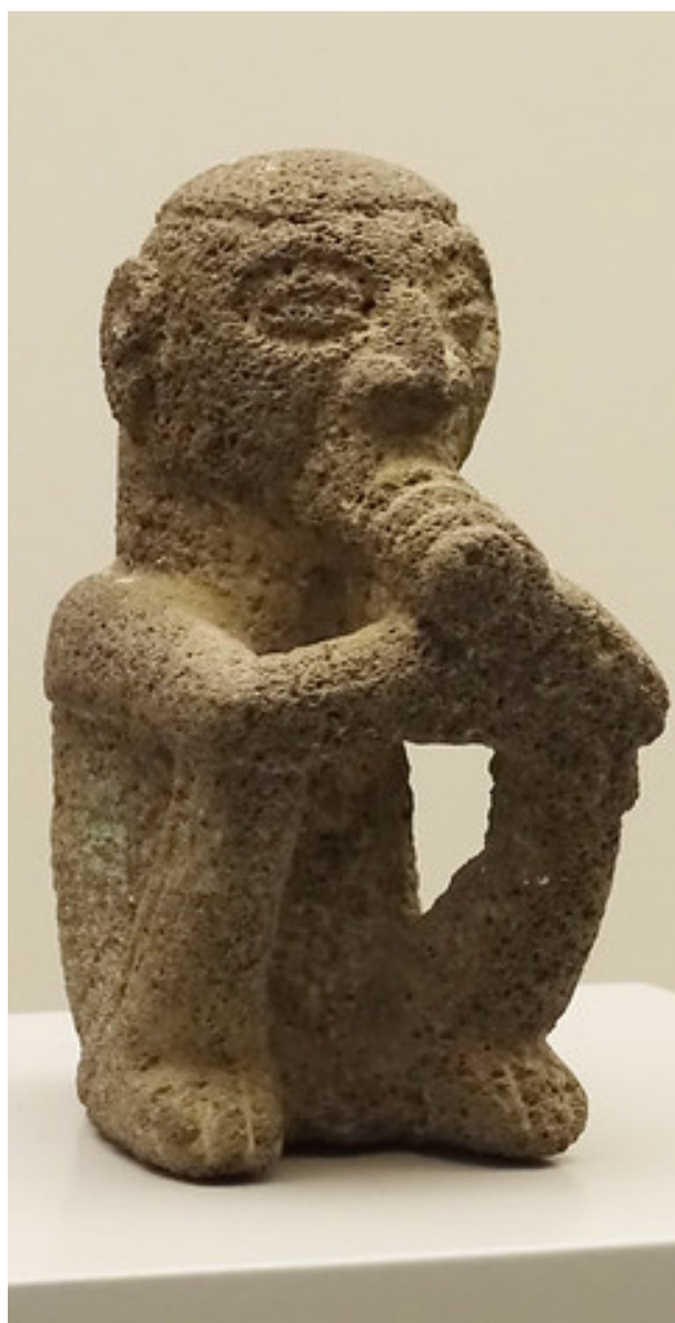
Escultura en pedra volcànica que representa un xaman.

El MEP té una mala pràctica que repercuteix en la seva labor professional i, a més, influeix en l'aprenentatge dels estudiants, com és la modificació dels