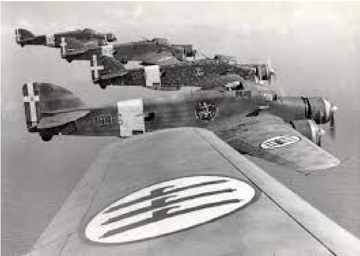
Aviació italiana, els Savoia Marchetti S. M. 79.