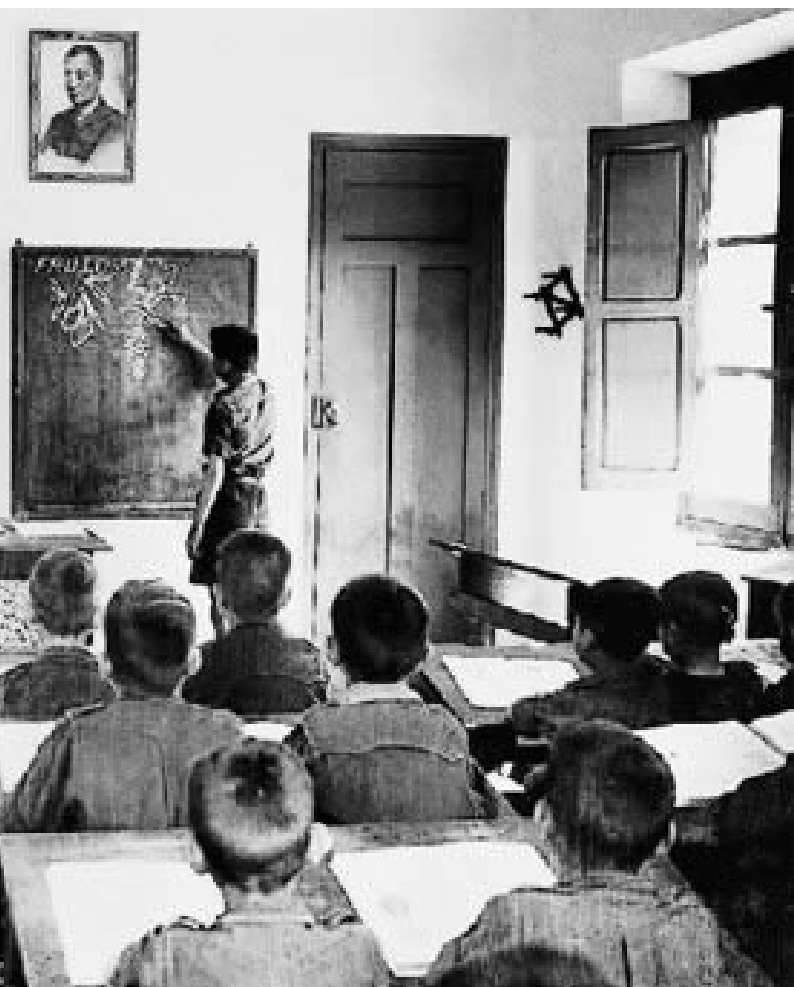
Escola franquista amb símbols polítics i religiosos.

La depuració del Magisteri no és una repressió provisional, temporal i improvisada conseqüència de la Guerra Civil, sinó una acció ben planificada, punitiva i definitiva. Carmen Agulló i J. Manuel Fernández, en un llibre crucial sobre la depuració del Magisteri Valencià, Maestros valencianos bajo el franquismo , analitzen quasi 2.400 expedients de mestres valencians i deixen testimoniat que: