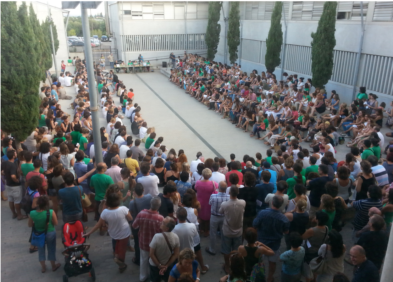
Assemblea de Docents 2013.

l'escola pública, laica, catalana, inclusiva, creativa i innovadora i a mantenir un sistema d'organització i de gestió pública. Tenim feina a no perdre la il·lusió, la creativitat, la mirada atenta, l'escolta oïda, l'afecte i l'estima per la nostra feina i els nostres infants i joves..., tenim moltes coses a salvaguardar, a promoure, a mantenir, a fer i a SER.