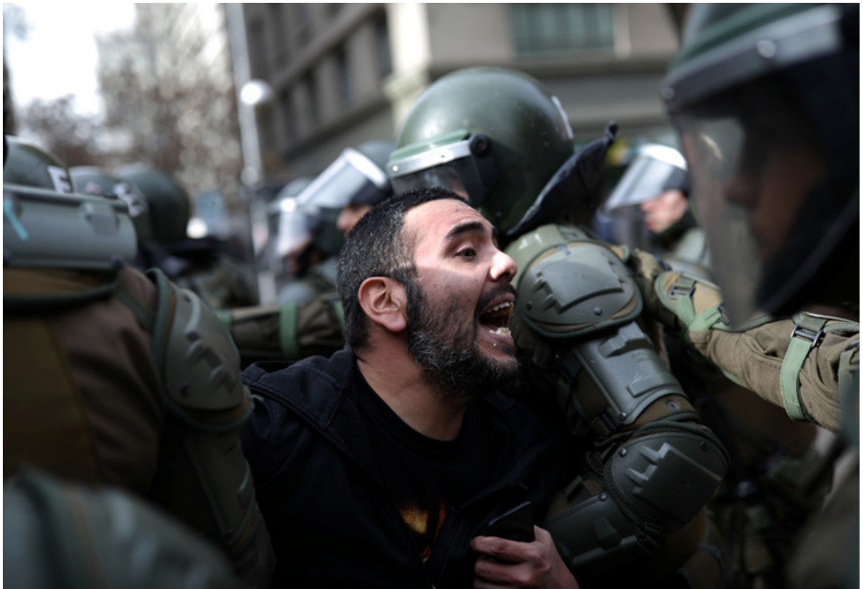
Manifestant detingut a la vaga nacional de mestres a Santiago, Chile, 20 de junio de 2019.

organitzacions arriba a constituir-se en una agenda política paral·lela a la dels governs, amb la definició d'orientacions de política nacional. D'acord amb les set trajectòries que va identificar l'estudi de la IE, "La Privatització Educativa a l'Amèrica Llatina, Cartografia de Polítiques Tendències i trajectòries", aquest conglomerat empresarial s'inscriu en les "Aliances Público Privades Històriques".