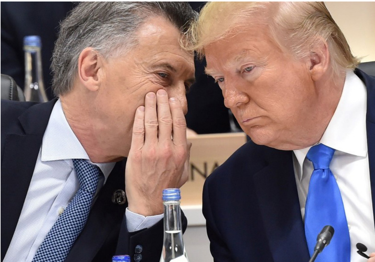
Mauricio Macri i Donald Trump.

de la majoria dels ciutadans, són perseguits, estigmatitzats, reprimits i fins i tot empresonats.