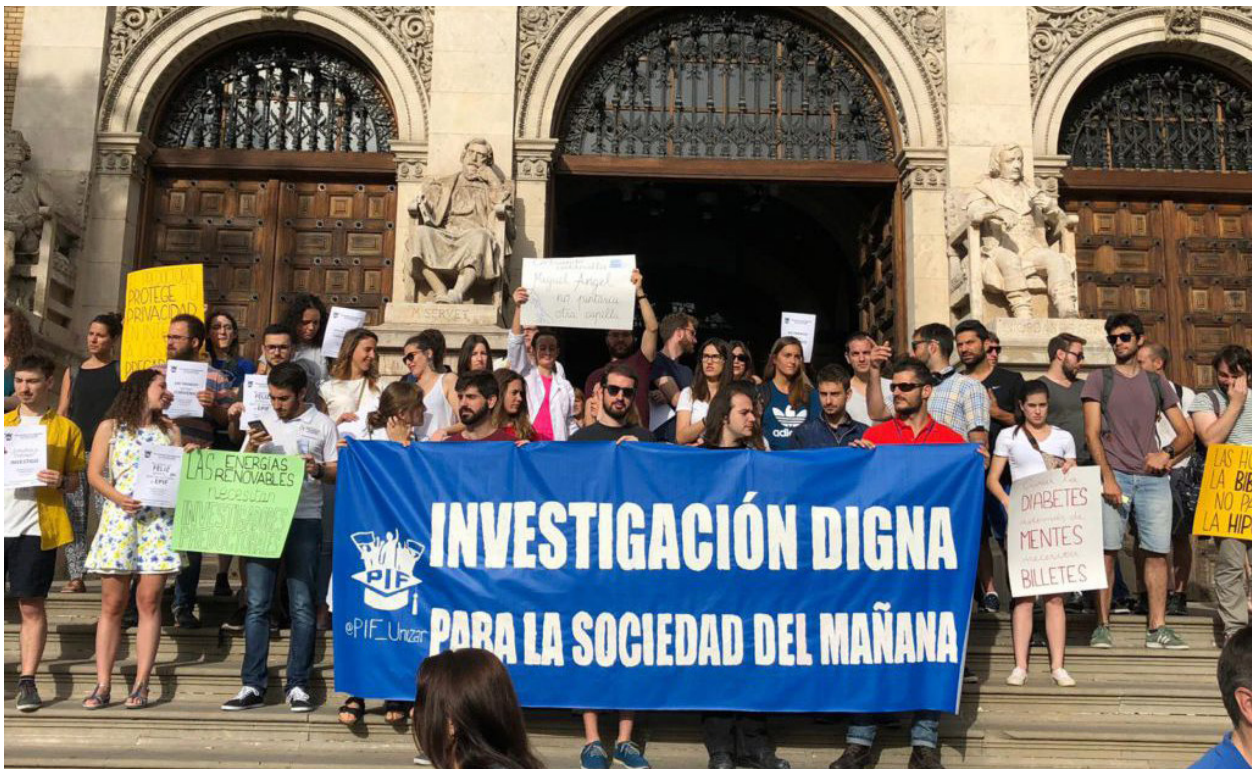
Personal Investigador en Formació PIF al Justicia de Aragón..

El professorat universitari a les universitats espanyoles es troba immers dins de diferents polítiques que condicionen el seu desenvolupament. D'una banda existeixen els condicionants pel que respecta a la seua existència com a tal, que depèn de la política de personal de cada centre, una acció poc homogènia així com en el últims anys e la taxa de reposició imposada pel Govern d'Espanya. Amb la jubilació del professorat, un sistema universitari saludable necessita una reposició, com a mínim, dels efectius amb que compta si no vol retrocedir en les quantitat i qualitat de les tasques que aquest desenvolupa. No menys important és la precarietat del personal investigador en formació (PIF) que desenvolupa una tasca fonamental al nostre sistema amb condicions laborals deficientes.