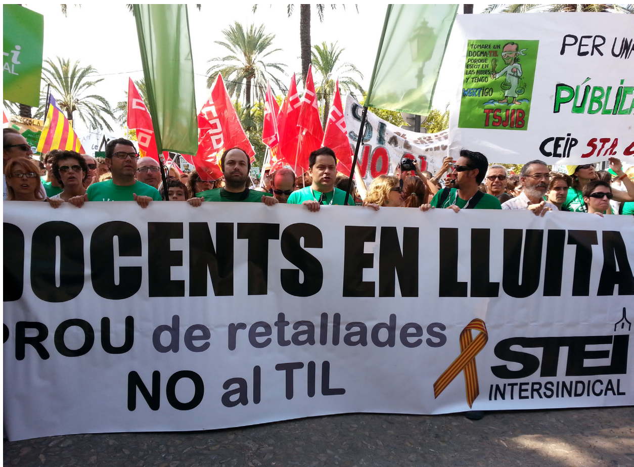
1r dia vaga indefinida concentració al Consolat 16 set 2013.

L'historiador Santiago Miró és un referent en l'estudi del tema que ens ocupa Maestros depurados en Baleares durante la guerra civil 5 i ens diu que els mestres no sabien mai de què se'ls acusava. Com que era un acte administratiu no tenien assistència jurídica. Les conseqüències foren diverses. Alguns van ser traslladats a un destí diferent dins la mateixa illa o a un nou destí a la península. Altres jubilats de forma anticipada o suspesos de sou i de feina i uns 23 mestres foren assassinats.